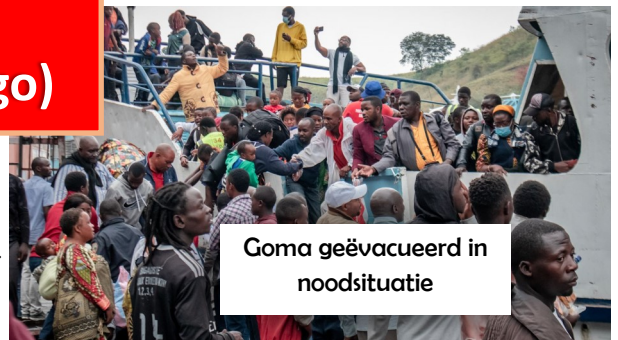
Goma geëvacueerd in noodsituatie

Wij hebben een oproep gekregen vanuit Congo (RDC) van een religieuze congregatie (De Zusters van de Heilige Familie van Helmet). De uitbarsting van de Nyragongo-vulkaan heeft voor paniek gezorgd in de stad Goma. Er is veel schade aangericht, niet alleen door de lava maar ook door aardbevingen. De zusters beheren in Goma 5 scholen, een ziekenhuiscentrum en een vormingshuis voor hen zelf. Deze zijn allen gelegen in de wijken waar de meeste schade is aangericht en ze hebben hulp nodig om de door deze ramp getroffen bevolking zelf te kunnen blijven dienen.